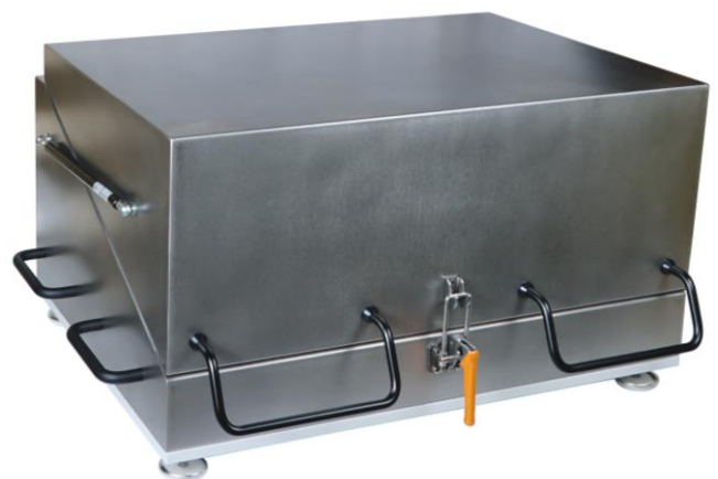
Abb. 2: Schirmbox mit den Abmessungen 1000 x 700 x 400 mm

Ventilatoren, Wabenkamine für Lüftung, Rohrdurchführungen für LWL, HF-Durchführungen, Interlock-Schalter, Schirmfenster, EMV-Filter, Mikrowellen-Absorber, kleine Antennen.